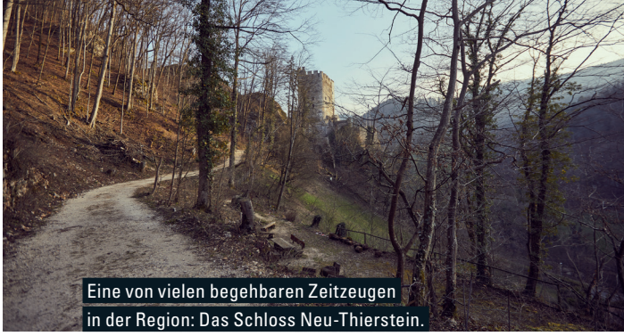
Eine von vielen begehbaren Zeitzeugen in der Region: Das Schloss Neu-Thierstein.