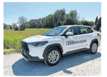
Der Toyota Corolla Cross Hybrid ist das Leserwandern-Auto 2023. Vielen Dank, Emil Frey AG, Safenwil!

Die richtige Antwort der 6. Frage lautete: Mühle Otelfingen