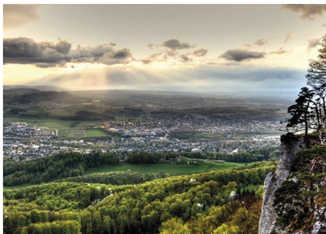
Konferenz der Gemeinderäte