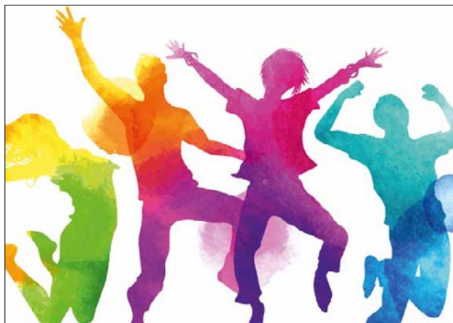
Gratulationsfeier Laufental Schwarzbubenland